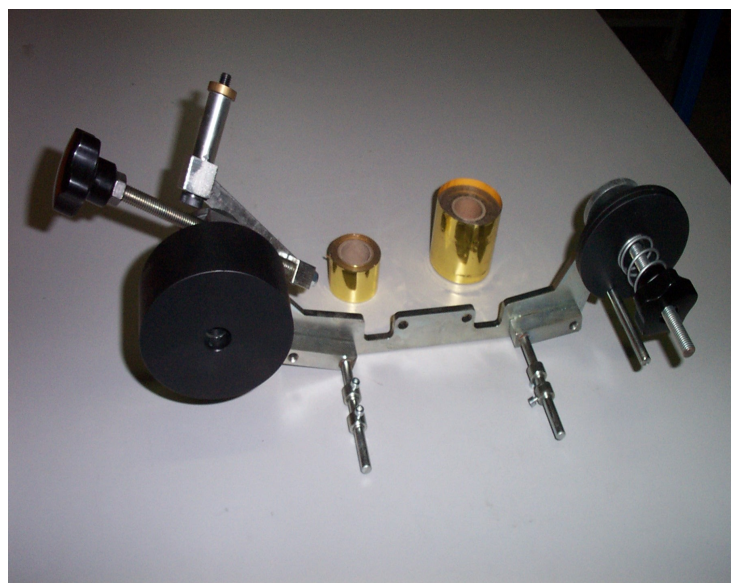
Dispositivo per marcatura con Oro -Gold Dispenser