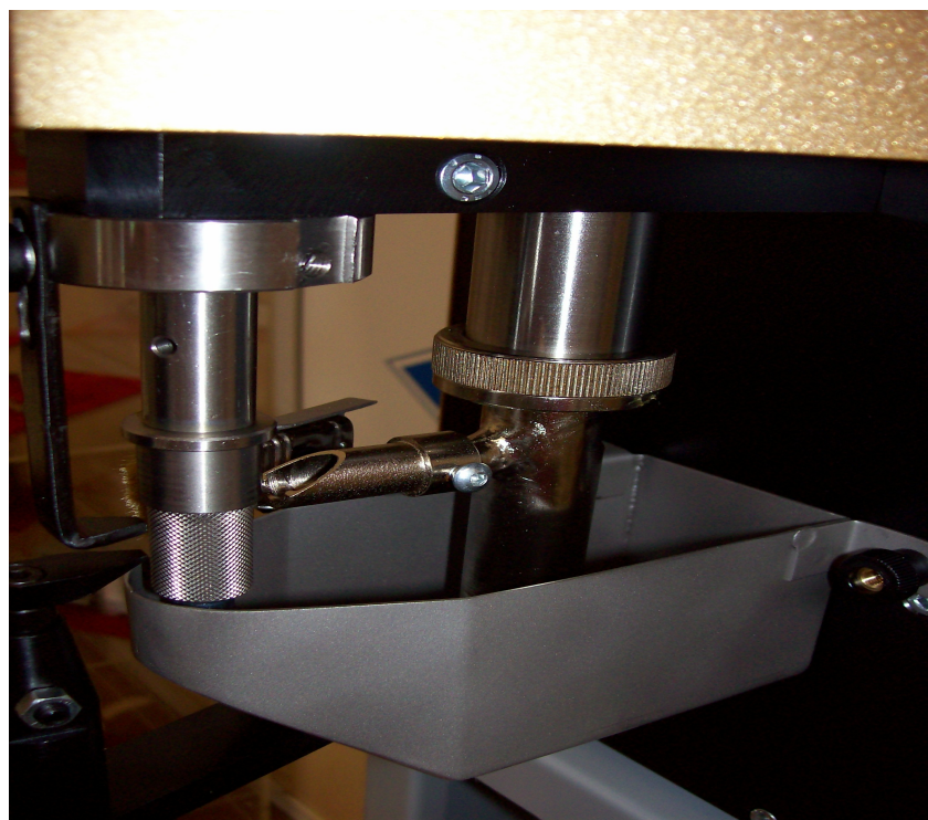
Particular of Paint alimentation system

Edge-dyer for bags, wallets etc. , in a single operation , edges and the exterior surface can be dyed with an agreeable design. All types of liquid colours can be used . Colour Waste is avoided through a device that removes the excess quantity and returns it to the dispenser again.It's possible have the version of speed adjuster( Mod. 170-VRS )