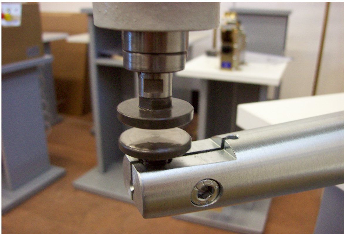
Particular of pressing head

Machine of great usefulness and easiest employment. It comes used in the industries of leather shops, shoe factories etc. Particularly indicated in order to beat again the ag after the application of the profile. This model comes used for the definitive crushing after the seam of connection and glueing. This machine regarding hand hammer manual it's faster of 75% .