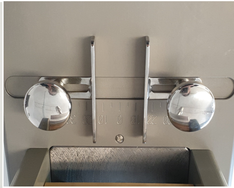
Guide registro larghezza