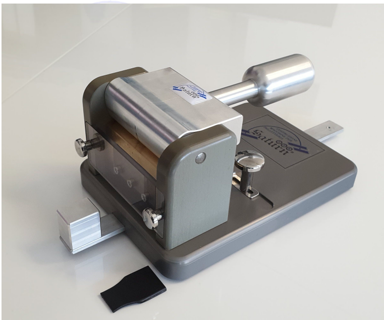
Posizione di taglio

The millimetric ruler with stop allows you to view the measure excess for cutting.