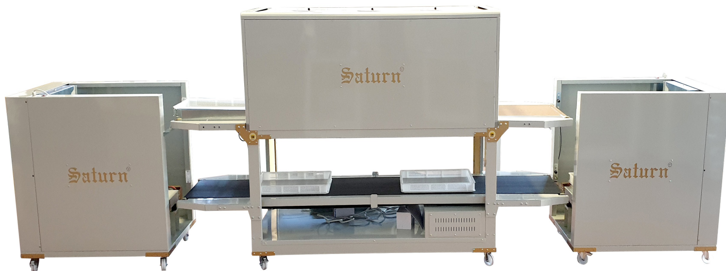
Model 7009 Lifter

Una volta ritornata indietro, l'elevatore (in questo caso) la riporterà in alto per essere rimossa.