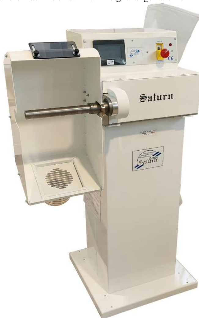
Versione 743B-VRAVP TOUCH con Aspiratore var. e sensori di prossimità