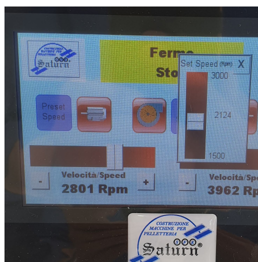
Schermata variazione della portata dell'aspiratore