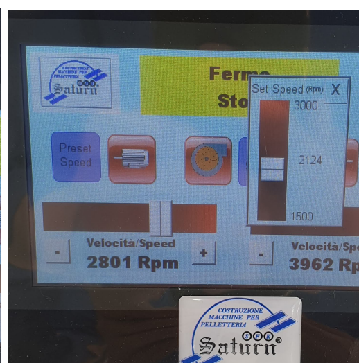
Schermata variazione della portata dell'aspiratore